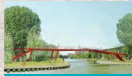
3. PASSERELLE DARSE