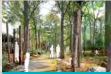
1. FORÊT LINÉAIRE