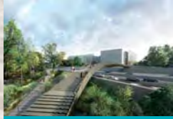
2. PASSERELLE PÉRIPHÉRIQUE